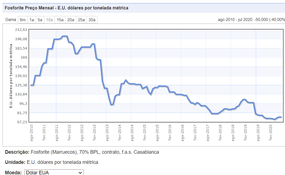
Figura 1. Gráfico da variação de preço do concentrado de fosfato nos últimos 10 anos.

No ano de 2020, o preço do concentrado de fosfato está nos menores níveis dos últimos 10 anos, com média de US$ 73 por tonelada conforme figura 2 1 .